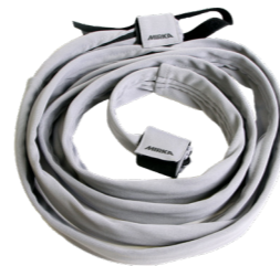
Mirka Sleeve for slange og kabel 3,5m MIE6515911