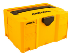
Mirka plast boks 400x300x210mm MIN6533011