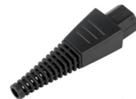
Rewireable Connector MIE9011111